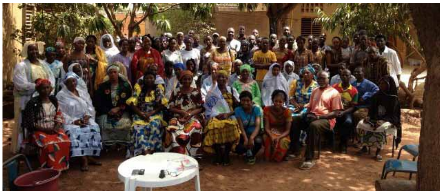
Alle ouders bijeen om het nieuwe beleid te horen.

voorbijganger aan. Ik heb nu al een paar keer meegemaakt dat een jonge vrouw me voor de vuist weg vroeg of ik geen werk voor haar had; maakte niet uit wat, schoonmaken, koken. Of die sympathieke jongen die een karretje met schroot duwde. Aan hem kan je voor € 0,65 per kg je oud ijzer kwijt. Dat vervolgens naar China verscheept wordt! Hij heeft 3 jaar middelbaar onderwijs gehad, maar is toen vanwege geldgebrek van school gegaan. Zonde; ik zag dat er veel meer in die jongen zat dan schroot ophalen. Hoe vaak ik al niet gehoord heb dat er geen geld meer is om naar school te gaan. Het blijft een grote luxe om je opleiding te kunnen afmaken."